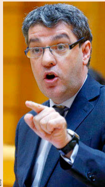
Álvaro Nadal es ministro de Energía.

cer ingeniería financiera para no subir la luz.