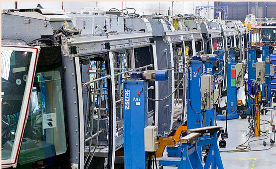
Además de ensamblar tranvías (imagen) y metros, Santa Perpètua aspira a construir también cercanías.

En números redondos, serán nuevos mil nuevos puestos de trabajo directos –ahora hay un millar de personas para los proyectos en marcha, sin tener en cuenta la seguri-